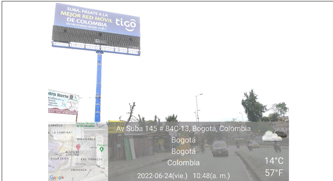
Foto No. 1 – Vista panorámica del predio, mástil, paneles y la estructura de la valla, ubicada en la Av. Carrera 145 No. 84 C – 13 (dirección catastral), orientación SUR – NORTE.