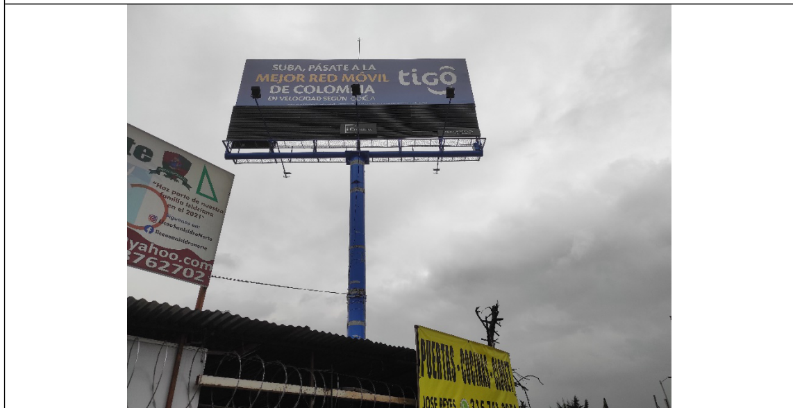
Foto No. 2 – Vista y detalles del panel y de la estructura de la valla, en buenas condiciones y estable de la valla, ubicada en la Av. Carrera 145 No. 84 C – 13 (dirección catastral), orientación SUR – NORTE